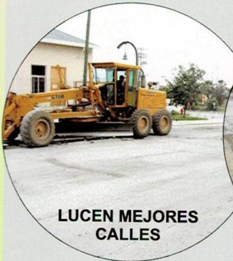
LUCEN MEJORES CALLES