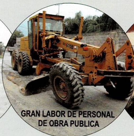
GRAN LABOR DE PERSONAL DE OBRA PUBLICA